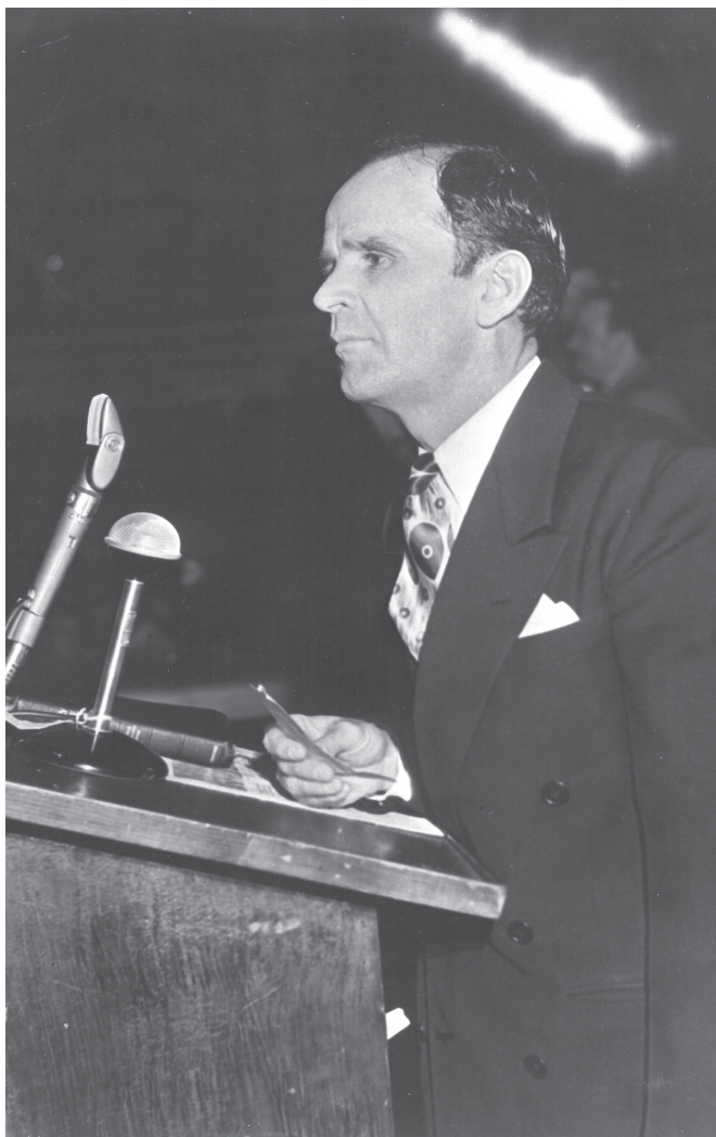
William Marrion Branham